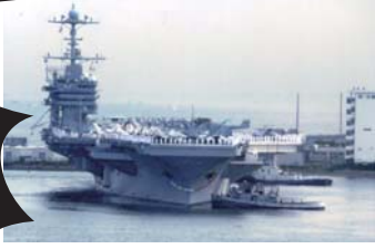
横須賀に配備された原子力空母ジョージ・ワシントン

原子力空母の母港とされる神奈川で、いのちと暮らしをかけてがんばる市民と交流しましょう