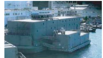
原子力空母配備に伴い横須賀に設置された原子炉関連修理施設