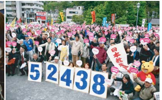
【写真左から】米兵犯罪被害者のたたかいも/思いひとつに、07年平和大会フィナーレ/青年も創意あふれる平和の取り組みを発言/横須賀では住民投票求め約10万の署名が