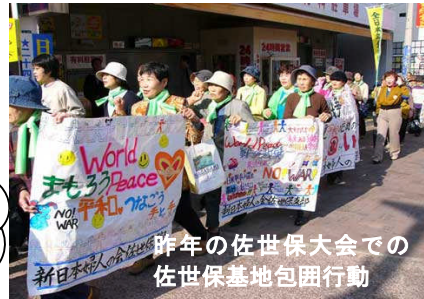
世界に広がる米軍基地反対の運動を交流

日本平和大会はこの危険な動きに反対し、米軍基地も軍事同盟もない、憲法 9 条の輝く平和な日本をめざす大会です。いま、沖縄や神奈川県・座間、横須賀、逗子、山口県・岩国、東京・横田など、米軍基地強化に反対する自治体・住民の運動が広がっています。憲法 9 条を守る共同の輪も広がっています。アジアでも世界でもアメリカの無法な戦争政策に反対し、米軍基地に反対する流れが強まっています。この流れをさらに広げるため、平和大会で共に学び、交流しましょう。