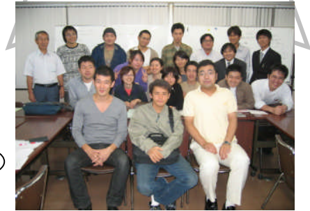
ピースシャウト実行委員会スタッフ

6 月、横浜での平和イベント「ピースインパクト」を大成功させた神奈川の青年が再び集結。全国の青年を熱くする大集會を企画中です。