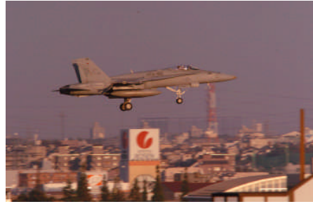
爆音まきちらす厚木基地