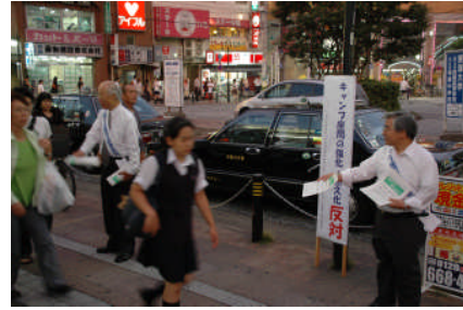
市長を先頭に米陸軍司令部移転反対を訴える座間市

神奈川県は、横須賀(米空母の世界唯一の海外母港)、厚木(空母艦載機離発着訓練)、座間(在日米陸軍)など、米軍基地が沖縄について集中している県です。