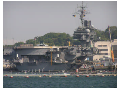
世界唯一の米空母海外母港、横須賀基地