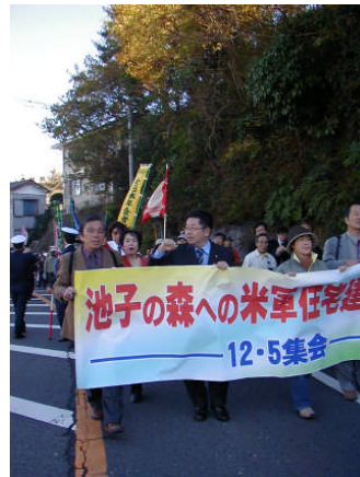
米軍住宅建設反対—池子

この神奈川へ、平和を守り、基地強化に反対する全国の運動が合流する05年日本平和大会。ぜひ、あなたもご参加を!