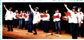
コーラスサークル 「しーさー」「こぼと」 合同合唱団

主催 2019年日本平和大会実行委員会 連絡先 東京都港区芝1-4-9平和会館4階 日本平和委員会気付 TEL03-3451-6377 FAX03-3451-6277