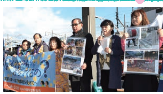
チーム緑ヶ丘1207 米軍ヘリ部品が落下した 宜野湾市の保育園保護者。 飛行停止を求めて行動する