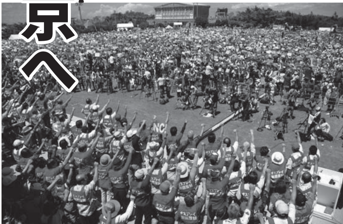
沖縄と全国の欠陥機オスプレイ配備反対の運動が大集合 (沖縄県民大会 =9月9日)