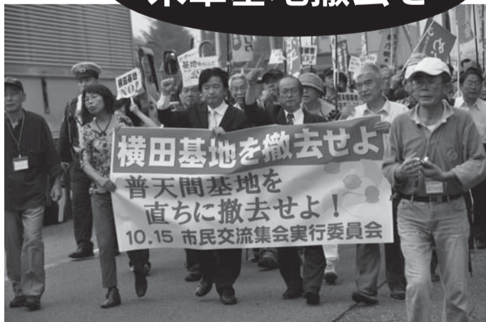
東京で広がる横田基地撤去の運動