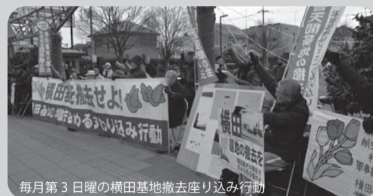
毎月第3日曜の横田基地撤去座り込み行動

世界で異例の首都におかれた米空軍横田基地。爆音被害をもたらすとともに、在日米軍司令部がおかれ、日米統合戦争司令部として強化されています。6月には航空自衛隊総隊司令部も移転。空の司令部も一体化しました。住宅地の真中で危険なパラシュート降下訓練も強行。オスプレイも飛来する計画です。